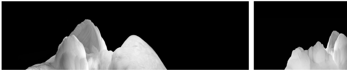
Daniela Monaci "arcipelago" dittico cm 160x 45 60x45

La chiave dell'opera di Daniela Monaci (creata nel 2008) sembra essere l'allusione. Tutto è già avvenuto altrove, in una base sconosciuta, da cui provengono creste pallide e irreali. Una trasformazione trascendentale di un immagine esaltata dalla estremizzazione dei colori negli antitetici bianco e nero.